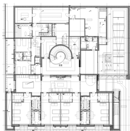
Plan du rez inférieur (930m 2 )